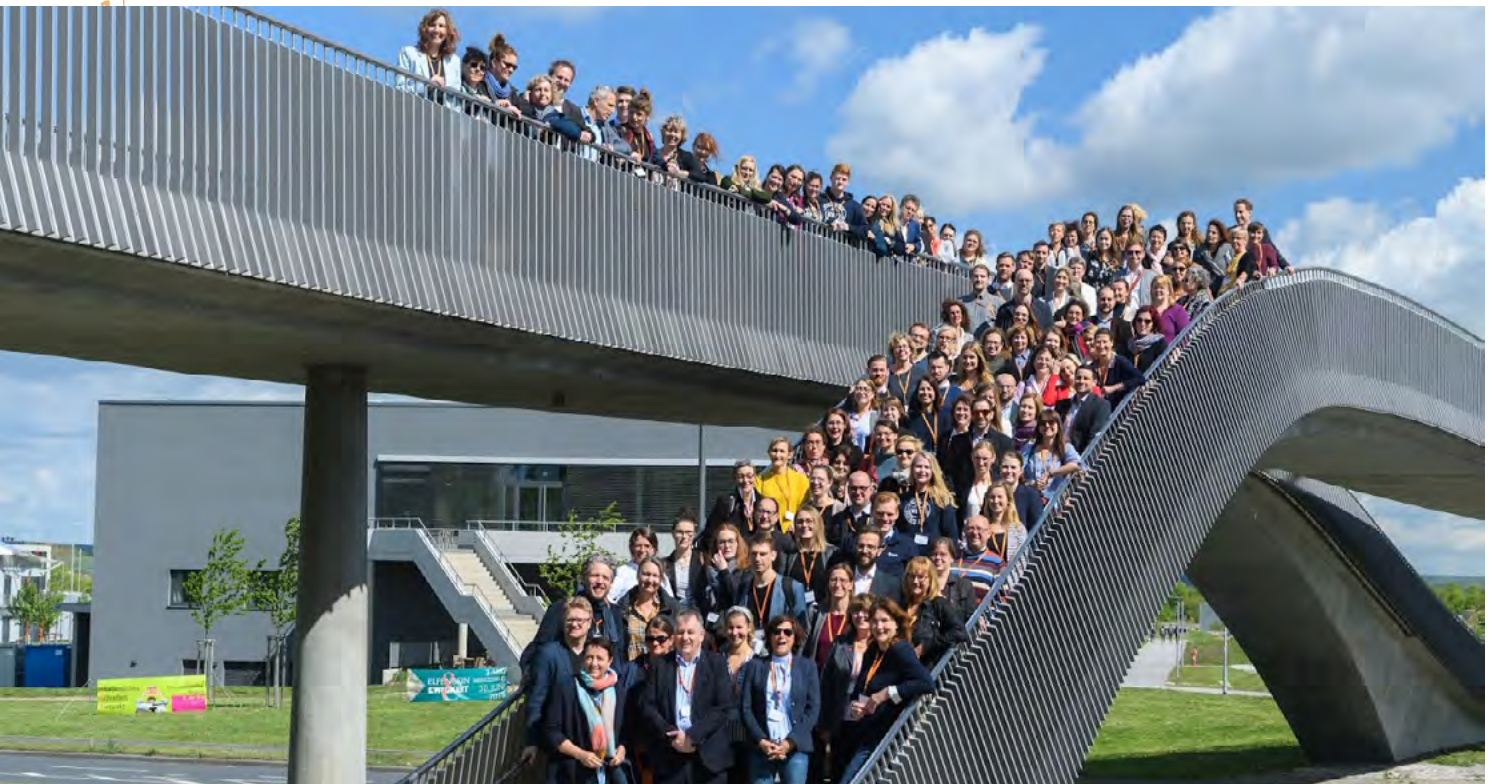
Die Teilnehmerinnen und Teilnehmer der 24. acn Konferenz in Würzburg