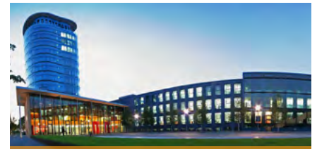
Die SRH Hochschule Heidelberg

Die 25. acn Konferenz 2020 findet vom 5. bis 7. Mai 2019 in Heidelberg statt. Die SRH Hochschule Heidelberg wird der Gastgeber unserer nächsten Jahreskonferenz sein. Informationen zur Konferenz finden sich auf der acn-Homepage.