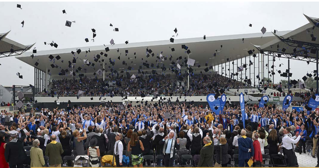
Begeisterung beim Graduiertenfest der RWTH Aachen am 9. September: Im Aachener Dressurstadion, sonst Arena für die weltbesten Pferde und Reiter, warfen die AbsolventInnen der Hochschule ihre Hüte in die Luft.