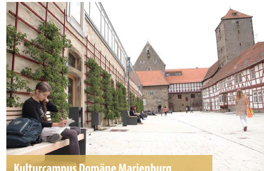
Kulturcampus Domäne Marienburg