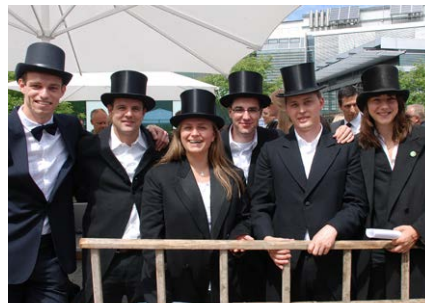
Traditionspflege: Kandelmarsch an der Hochschule Esslingen

„Nah an Mensch und Technik“ ist das Motto der Hochschule Esslingen. Die Hochschule Esslingen sorgt für die akademische Ausbildung in den Bereichen Ingenieur-, Wirtschafts-, Sozial- und Pflegewissenschaften. Rund 6.100 Studierende sind in 26 Bachelor- und zwölf Masterstudiengängen eingeschrieben – rund 6.000 aktive Alumnae und Alumni sind in der Datenbank registriert.