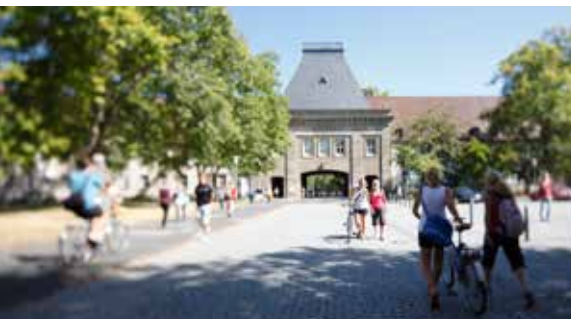
Johannes Gutenberg-Universität Mainz

Die Johannes Gutenberg-Universität Mainz (JGU) ist eine internationale Forschungsuniversität und zählt mit rund 36.000 Studierenden zu den zehn größten Universitäten Deutschlands. Als einzige Volluniversität und wissenschaftliches Zentrum des Landes Rheinland-Pfalz vereint die JGU nahezu alle akademischen Disziplinen auf dem innenstadtnahen Gutenberg-Campus. Rund 4.150 Wissenschaftlerinnen und Wissenschaftler, davon 540 Professorinnen und Professoren, forschen und lehren in mehr als 150 Instituten und Kliniken. Einmalig in der bundesdeutschen Hochschullandschaft ist die Integration der Universitätsmedizin Mainz sowie zweier künstlerischer Hochschulen unter dem Dach der JGU.