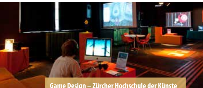
Game Design – Zürcher Hochschule der Künste

Die Kunsthochschule Berlin Weißensee steht in der Tradition des Bauhauses und verbindet interdisziplinär Kunst und Gestaltung. Das fachliche Angebot für 800 Studierende der Hochschule umfasst neben den BA- und MA-Studiengängen im Bereich des Designs – Mode-Design, Textil- und Flächen-Design, Produkt-Design, Visuelle Kommunikation – sowie der Freien Kunst – Malerei, Bildhauerei, Bühnen- und Kostümbild – die beiden Weiterbildungsmaster Raumstrategien und Kunsttherapie.