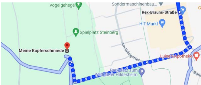
Abbildung 1: Rex-Brauns-Straße, zu Fuß ca. 11 min (0,7 km) zur Kupferschmiede (Steinberg 6)